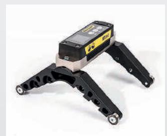
Accesorios para el rodillo de diámetro 55-800 mm. N.º art. 12-0901.

Easy-Laser® es un producto de Easy-Laser AB, Alfagatan 6, SE-431 49 Mölndal, Suecia Tel.: +46 31 708 63 00, Fax: +46 31 708 63 50, Correo electrónico: info@easylaser.com, www.easylaser.com © 2020 Easy-Laser AB. Reservado el derecho a efectuar modificaciones sin previo aviso. Easy-Laser® es una marca registrada de Easy-Laser AB. Apple, el logotipo de Apple logo, iPhone y iPod todo son marcas comerciales de Apple Inc., registradas en EE. UU. y otros países. App Store es una marca de servicio de Apple Inc. Las demás marcas comerciales pertenecen a sus respectivos titulares. Este producto cumple las siguientes normas: EN60825-1, 21 CFR 1040.10 y 1040.11 FCC ID: Q0QBGM13P, IC: 5123A-BGM13P. ID de documentación: 05-0975 Rev1