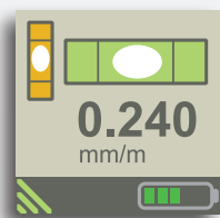
Clara visualización en XT290. Valores y gráficos en tiempo real.

Alinee con valores en tiempo real y documente en formato PDF. (App XT Alignment para iOS y Android. Programa Valores/Nivel).