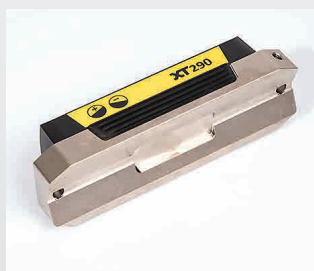
Base prismática rectificada con precisión. Dos orificios para soportes y adaptaciones personales.